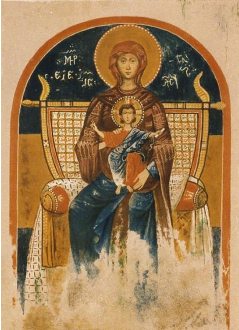
Brindisi. Santissima Trinità. Cripta. Madonna in Trono. Affresco. Da D. SALAZARO, Studi sui monumenti dell'Italia meridionale dal IV al XIII secolo , p. II, Napoli 1887.