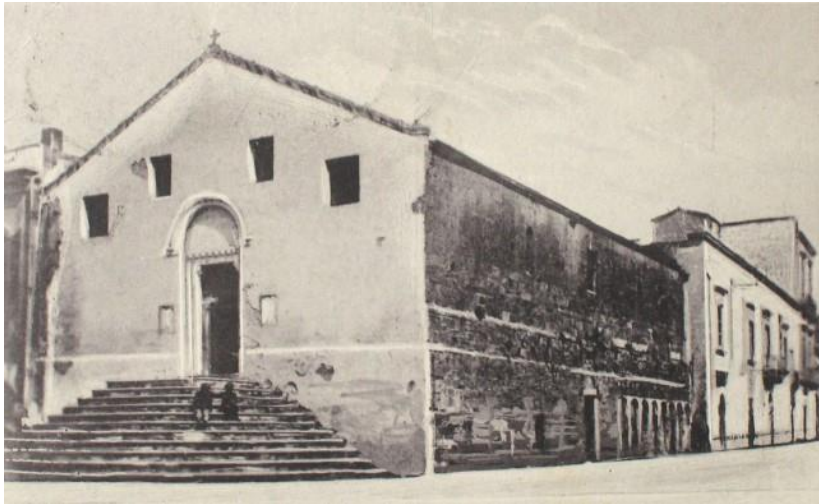
Brindisi. Chiesa della Santissima Trinità. Ph. 1923.