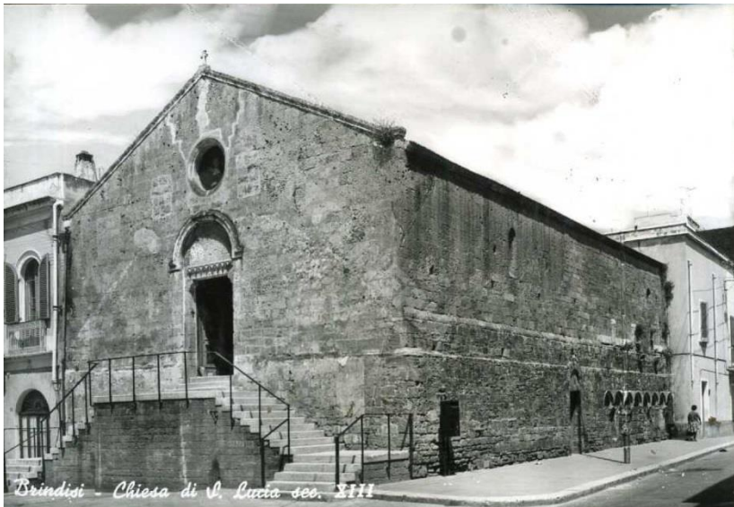
Brindisi. Chiesa della Santissima Trinità.

Monialium Nigrarum et Sancte Trinitatis Monialium Albarum pro quacumque causa intrare in dictis monasteriis cum abatissa priorissa vel monialibus esse aut aliter conversare presumat sub excommunicationis pena nichilominus iniungentes omnibus et singulis hominibus civitatis Brundusii quam etiam ipso facto incurrant et de cetero in eorum festivitibus infirmitatibus aut aliis eorum negotiis nullam monialem...quecumque fuerit consanguinea vel affinis in eorum domibus recipiant aut retineant quoquo modo, cum ubi sunt dedicate ibi debeant perpetuo permanere nec illa exire aliqua racione».