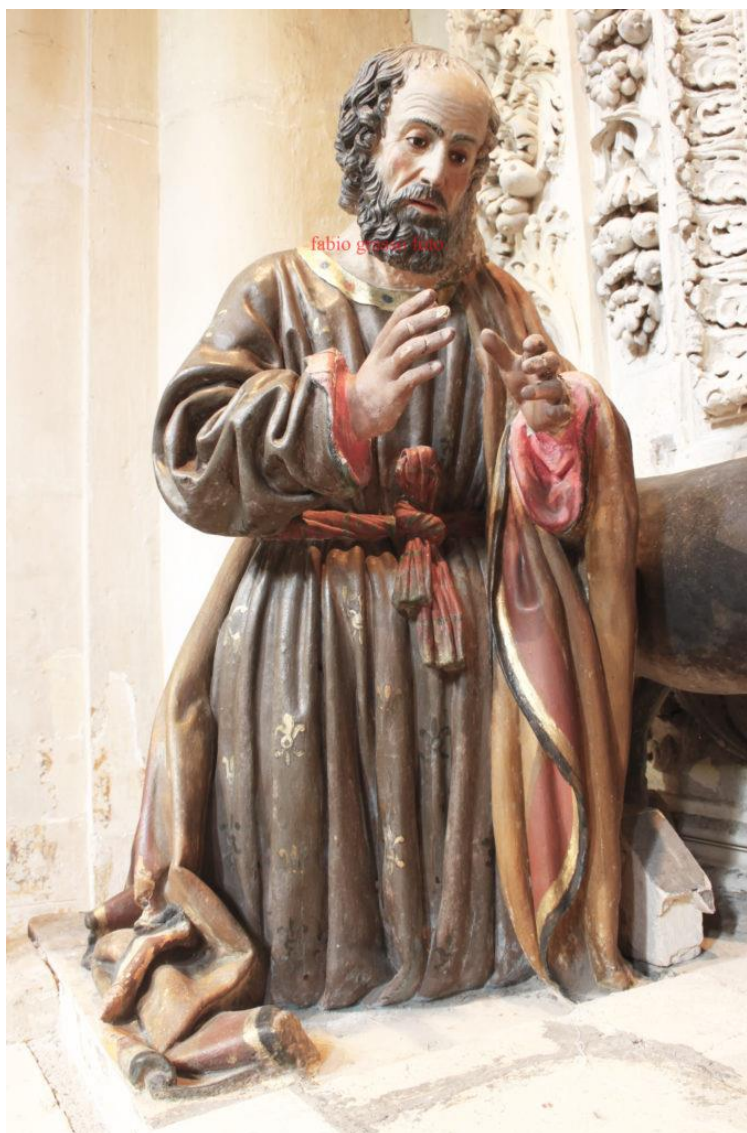
Lecce. Cattedrale. Altare della Natività.