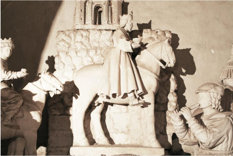
Lecce. Cattedrale. Altare della Natività.

Nel 1774 l'arcivescovo Giuseppe Rosi (1764-78) dispose che il beneficio degli Escobedo, già Galliego, fosse legato al tuttora esistente altare di San Pelino, su cui è una tela del Tiso (1726-1800), inaugurato da Annibale De Leo nel 1771 e collocato in fondo alla navata destra della Cattedrale quasi a copertura di una delle absidi laterali 10 .