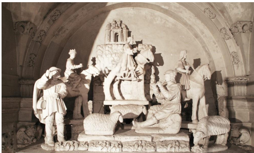
Lecce. Cattedrale. Altare della Natività.

A Lucio Macedonio seguiranno, dopo 1606, Pietro Buesso, di famiglia spagnola imparentata con gli Escobedo e, nel 1623, Giovanni Granafei (1605-83), vescovo di Alessano dal 1653 al 1666 e da quell'anno e sino al 1683 arcivescovo di Bari. Titolare del diritto di patronato è Diego Escobedo; essendo tuttavia impegnato in Cristo servitijs Catholicae Maestatis lo esercita attraverso il nipote, suo procuratore, Ferdinando Buesso 8 .