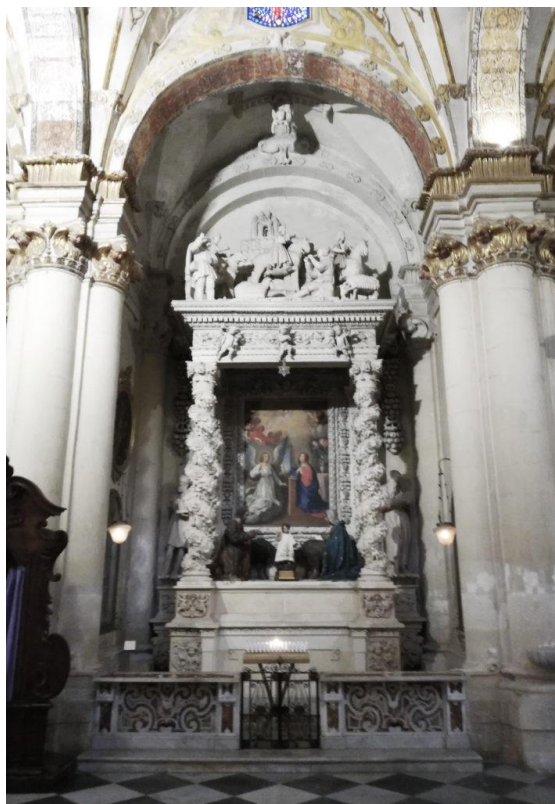
Lecce. Cattedrale. Altare della Natività.

Lucio Macedonio aveva ottenuto la cappellania dell'altare « sub invocatione de praesepio », seguita la morte di Camillo Sciala, dall'arcivescovo Bernardino de Figueroa (1571-86), nel 1583; era stato proposto per l'incarico dal titolare del diritto di patronato Diego Escobedo, figlio di Apollonia Galliega 7 .