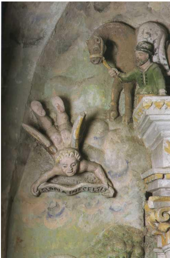
Torre Santa Susanna. Santa Maria di Galaso. Presepe.