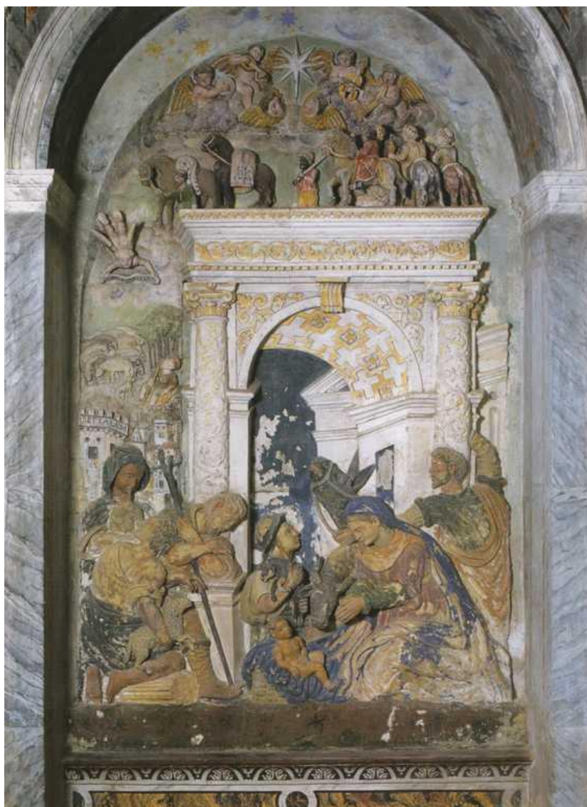
Torre Santa Susanna. Santa Maria di Galaso. Presepe.