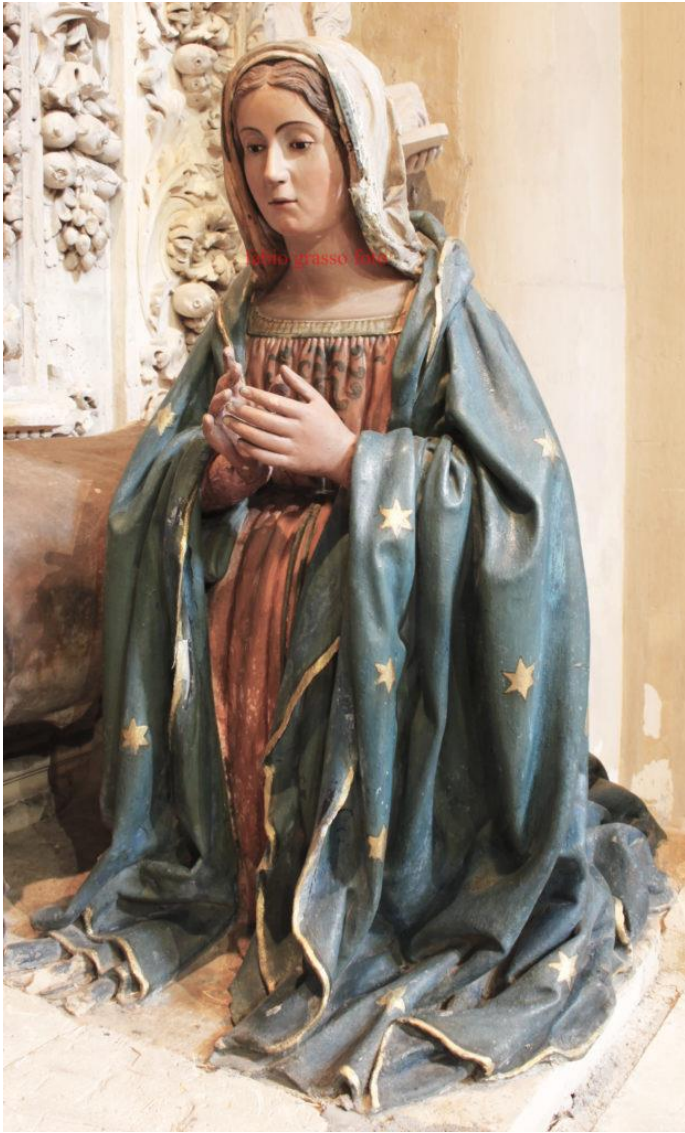
Lecce. Cattedrale. Altare della Natività.